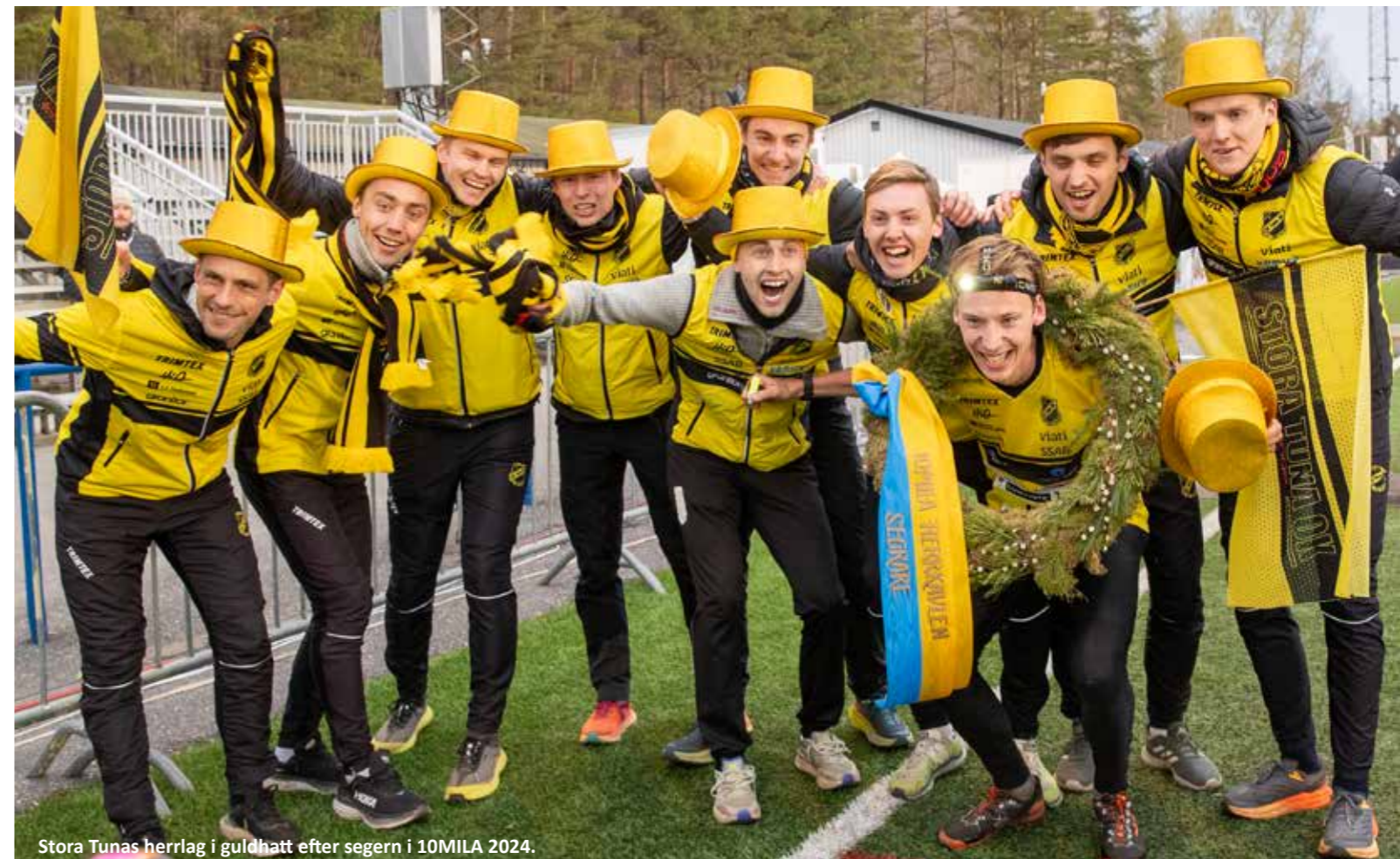
Stora Tunas herrlag i guldhatt efter segern i 10MILA 2024.

Den inställningen torde å andra sidan vara nog för sätta skräck i det övriga startfältet. Alla minns ju hur det gick för Stora Tuna i våras i Nynäshamn.