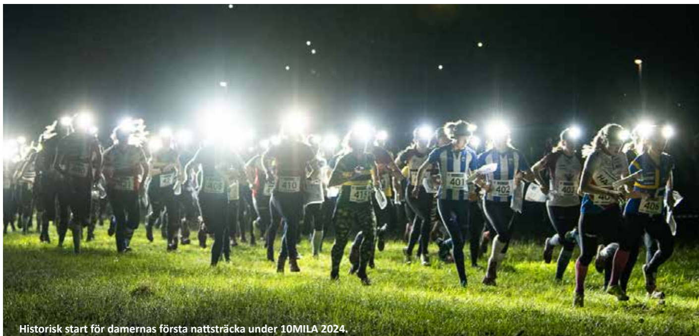
Historisk start för damernas första nattsträcka under 10MILA 2024.

Undersökningen visar ändå att majoriteten av deltagarna accepterar förändringen (är positiva eller neutrala till den).