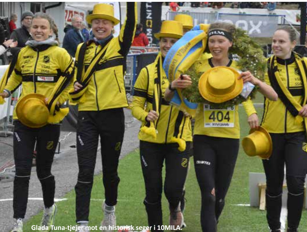
Glada Tuna-tjejer mot en historisk seger i 10MILA.

Segern på herrsidan i Nynäshamn bildade samtidigt ett snyggt mönster eftersom det var 60 år sedan klubbens första triumf i 10MILA. Ett ungt Stora Tuna, med fyra 19-åringar i laget, kom från "ingenstans" och sprang hem 1964 års upplaga vid Malmahed. När 60-årsjubileet av framgången firades härförleden var sju av de tio medlemmarna i segrarlaget på plats. En oförglömlig afton fylld av skratt och ljusa minnen.