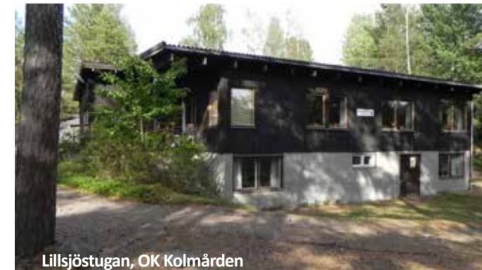
Lillsjöstugan, OK Kolmården