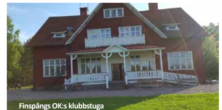
Finspångs OK:s klubbstuga

Gå in på Visit Norrköping för mer information. Här hittar du många alternativ på bra hotell. https://visit.norrkoping.se/overnatta/temasidor/hotell-i-city